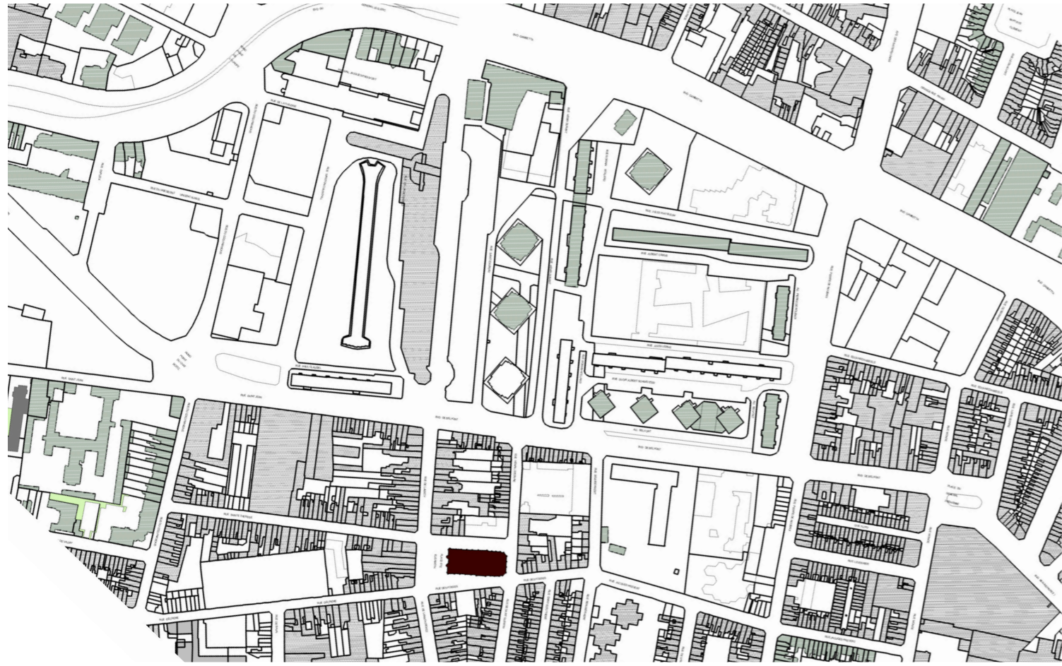
Agence Patrice MOTTINI