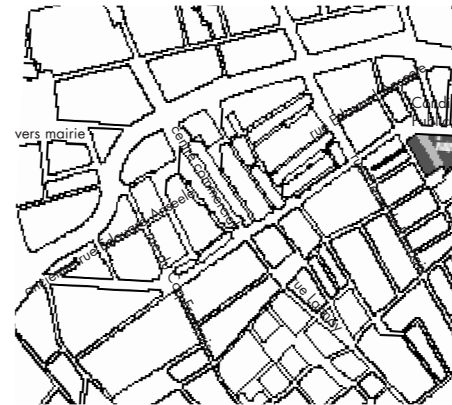
Quartier Edouard Anseele en 2007