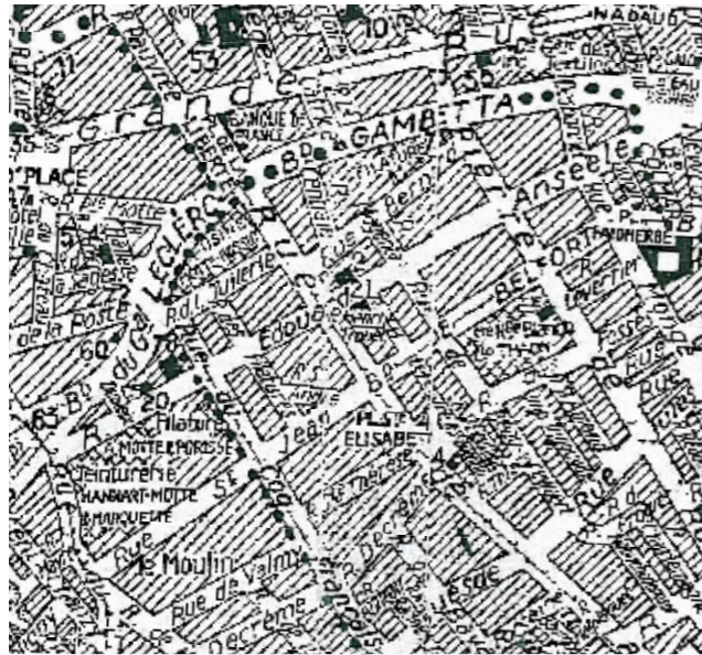
Quartier Edouard Anseele en 1961