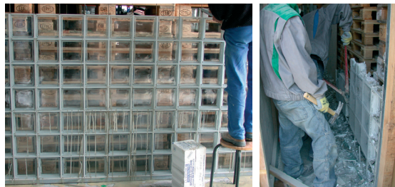
Démontage des façades en briques de verre