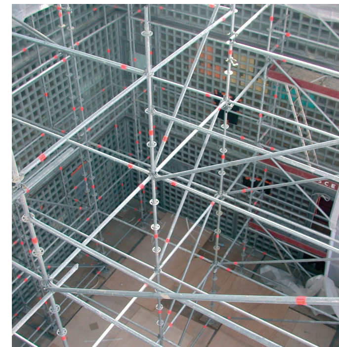
Echafaudage à l'intérieur d'un atrium