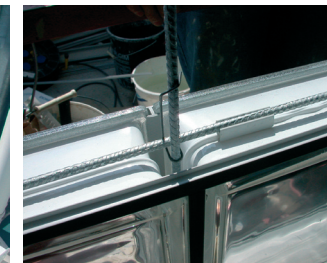
Montage des nouvelles façades