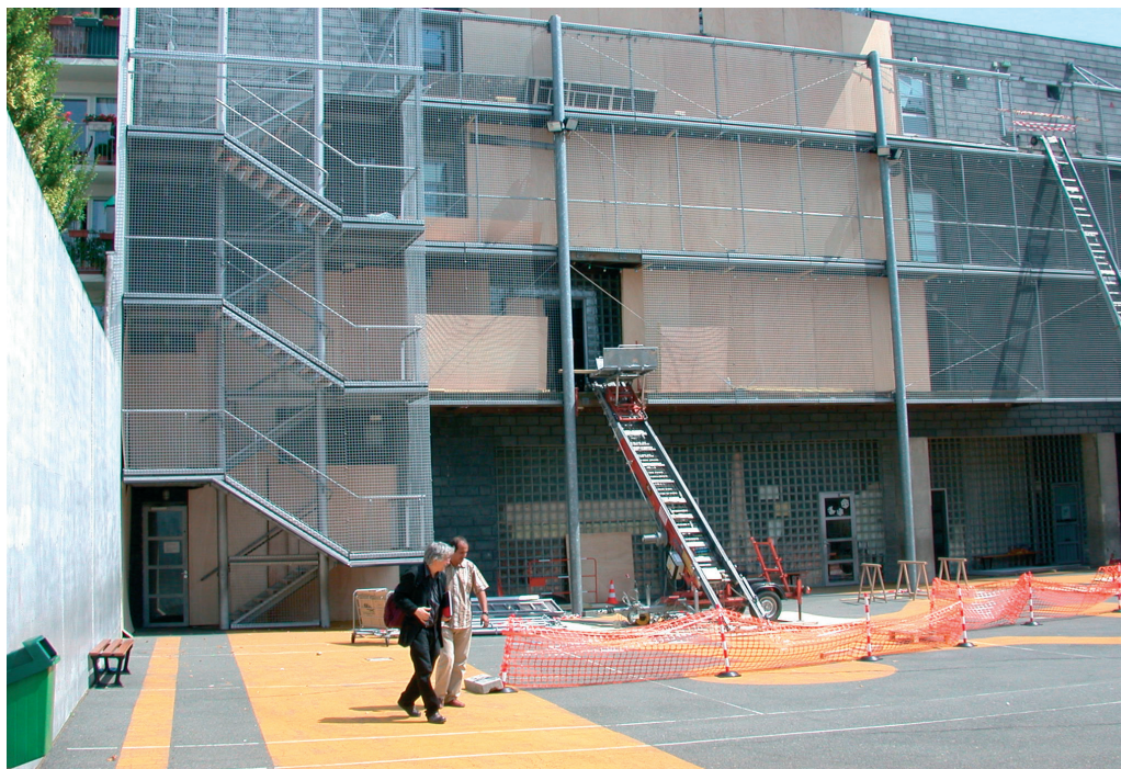
L'école pendant les travaux

QUALITÉS ENVIRONNEMENTALES ET TECHNIQUES: Mise au point de procédés techniques de démontage et de reconstruction de la façade plus propres et efficaces. Chantier réalisé en 2 mois au lieu des 4 prévus, in site occupé.