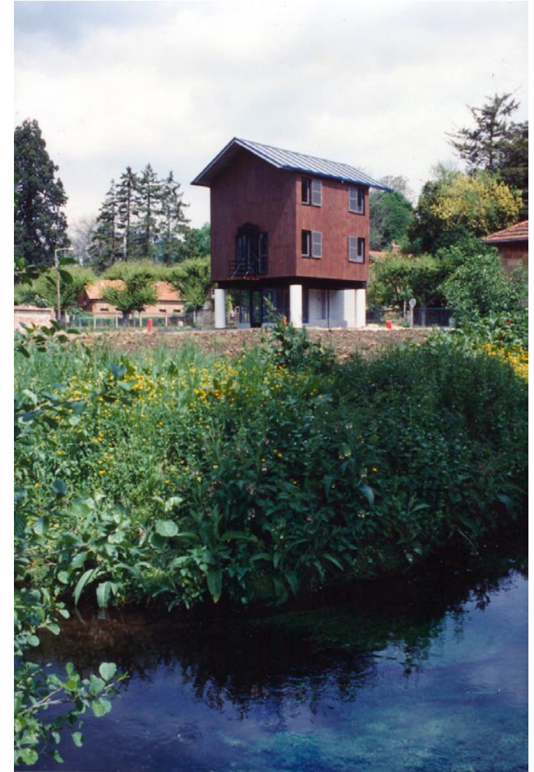
La maison dans son environnement