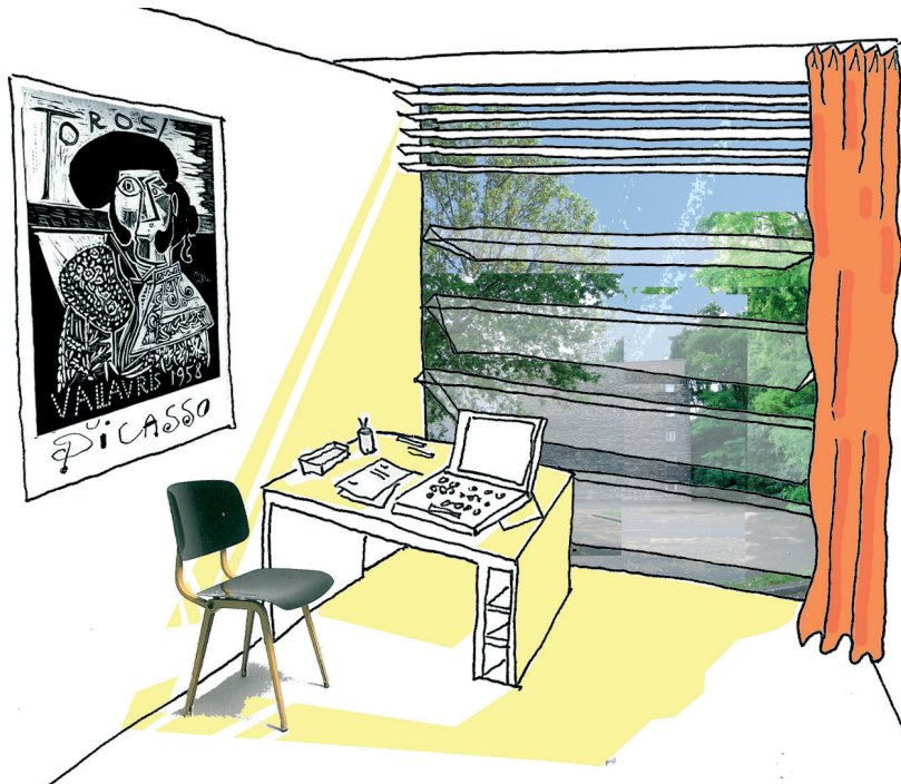
Orientation des logements étudiants côté sud et vers le jardin

QUALITÉS ENVIRONNEMENTALES ET TECHNIQUES: - Traitement des nuisances acoustiques - Logements orientés au sud avec vue sur un jardin - Logements étudiants traversants