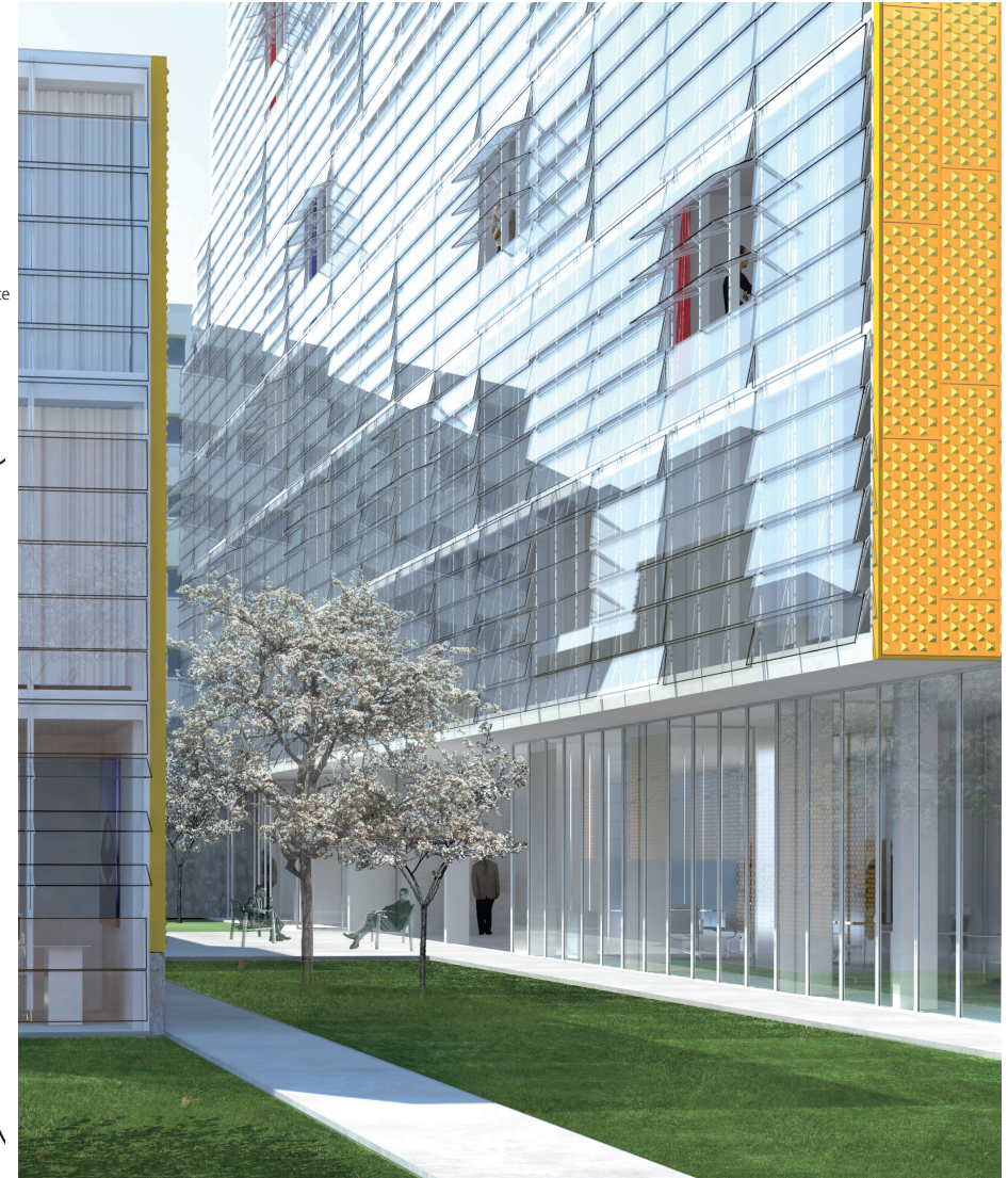
La façade a été travaillée selon des principes bioclimatiques de ventilation et d'ensoleillement